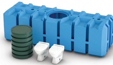
FANN Green Toalettsystem dubbel