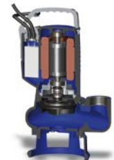
DG BLUE PRO