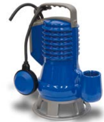
DG BLUE PRO

Pumpar där typbeteckningen avslutas med "MA" eller "TA" är försedda med nivåvippa för start-stopp av pump, övriga levereras utan automatik.