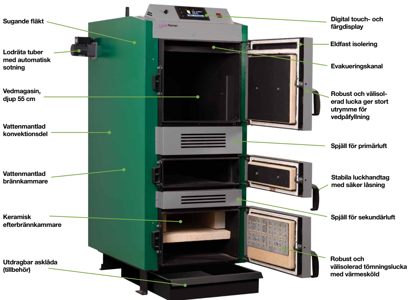
Calmarpannan V40 Ecodesign.