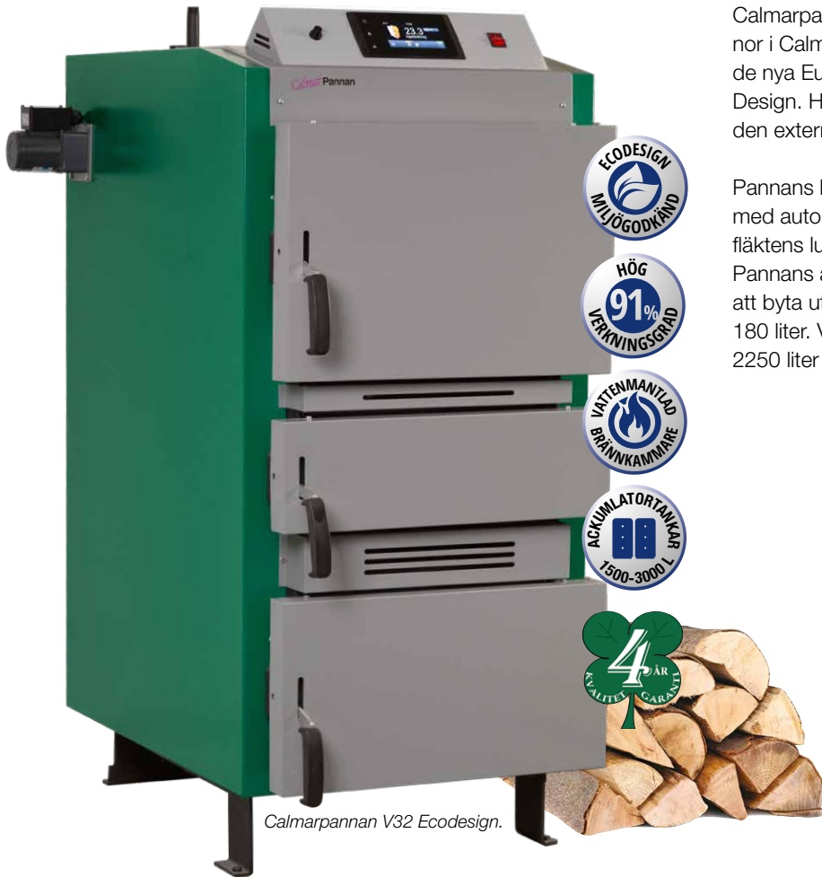
Calmarpannan V32 Ecodesign.

Calmarpannan V32/V40 Ecodesign är två nya vedpannor i Calmarpannan serien. Utvecklade för att uppfylla de nya Europakraven EN 303-5:2012 (klass 5) och Eco Design. Här laddar du pannan full, tänder veden genom den externa tändningsluckan i mitten.