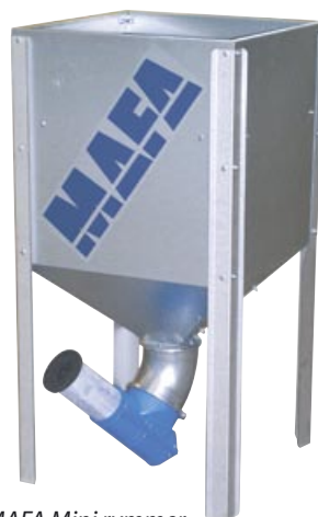
MAFA Mini rymmer 300 liter + ev. 200 liter = 500 liter med förhöjningssektion.