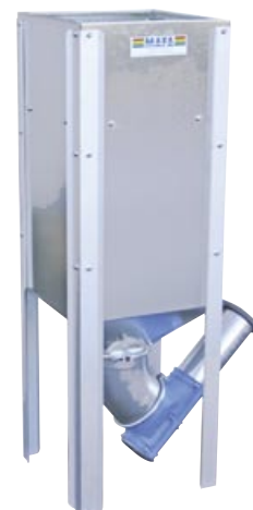
MAFA Micro är den minsta modellen, rymmer 127 liter.