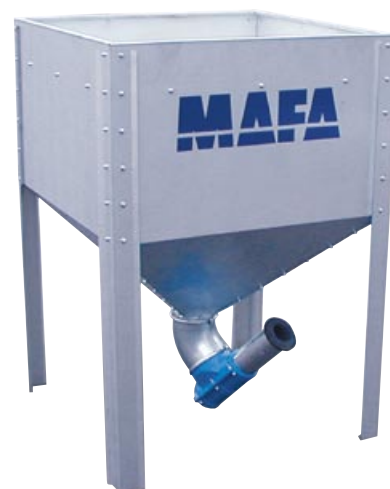
MAFA Midi är den största modellen, rymmer 730 liter.

Kontakta din lokala installatör och boka tid för ytterligare information och prisuppgift.