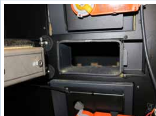
Tändlucka (gäller 40 och 50-modellerna)