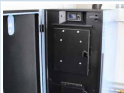
Excellentpanna med Lambdastyrning