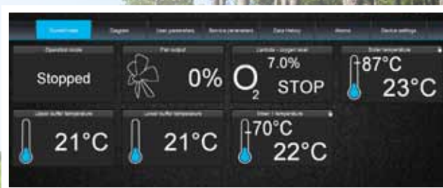
Styrning via ecoNET