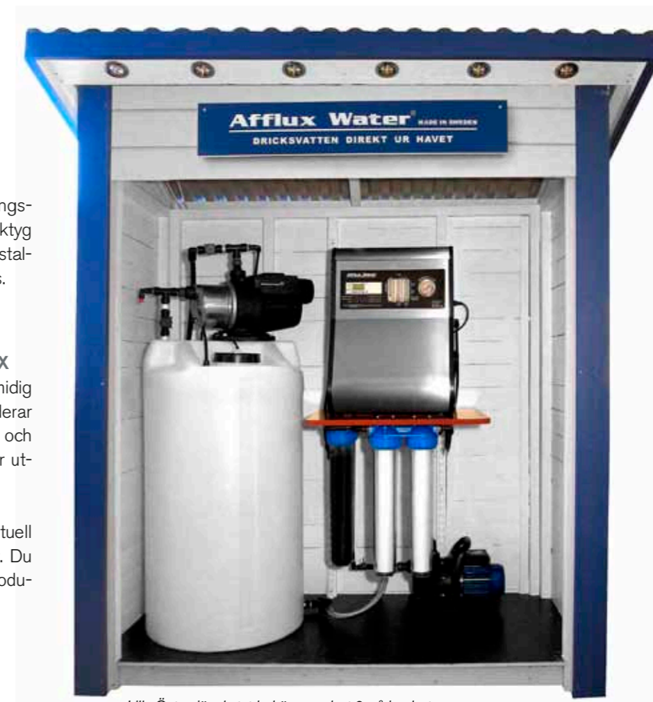
Lilla Östersjöpaketet behöver endast 2 m 2 i golvyta.