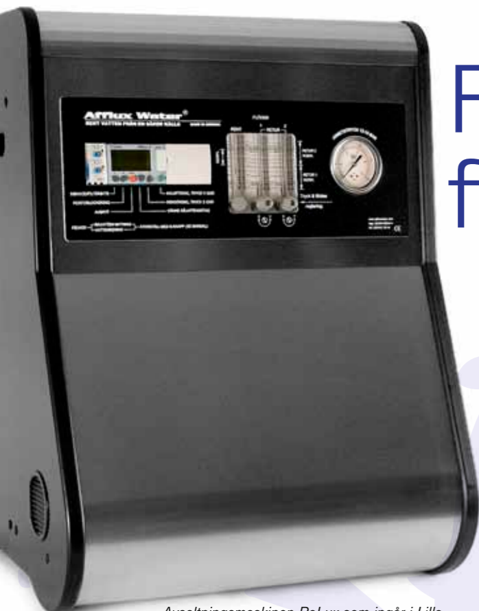
Avsaltningsmaskinen RoLux som ingår i Lilla Östersjöpaketet är med sin kompakta design enkel att installera, använda och underhålla.

Vatten klassas som livsmedel och det är därför mycket viktigt att kvaliteten på det avsaltade vattnet håller hög klass. Vår unika kvalitetskontroll för rent vatten larmar direkt ifall det uppstår brister i processen. Kvalitetskontrollen sker genom en konduktivitetmätning och vid ev. brist upphör produktionen av vatten omedelbart.